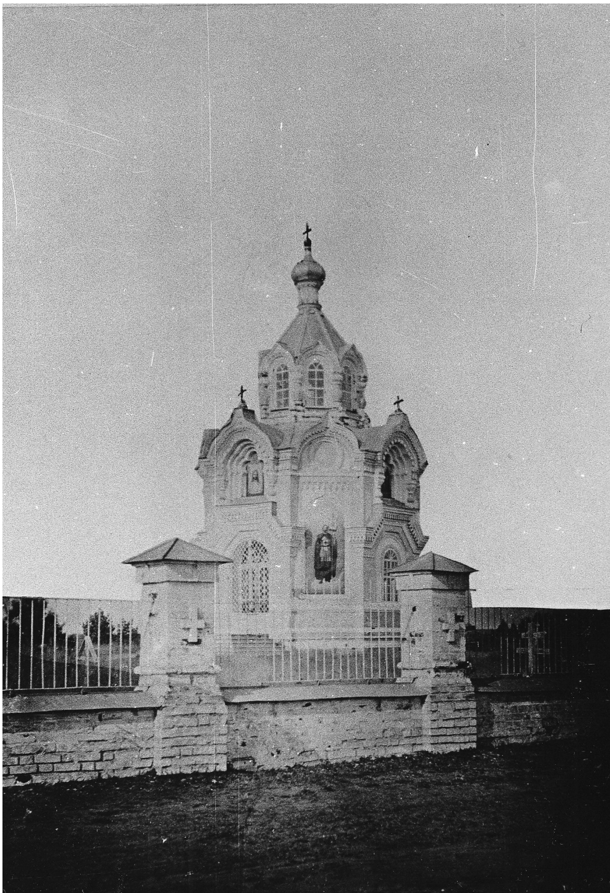
Фото 2. Спасо-Александровская кладбищенская часовня. Начало XX века.