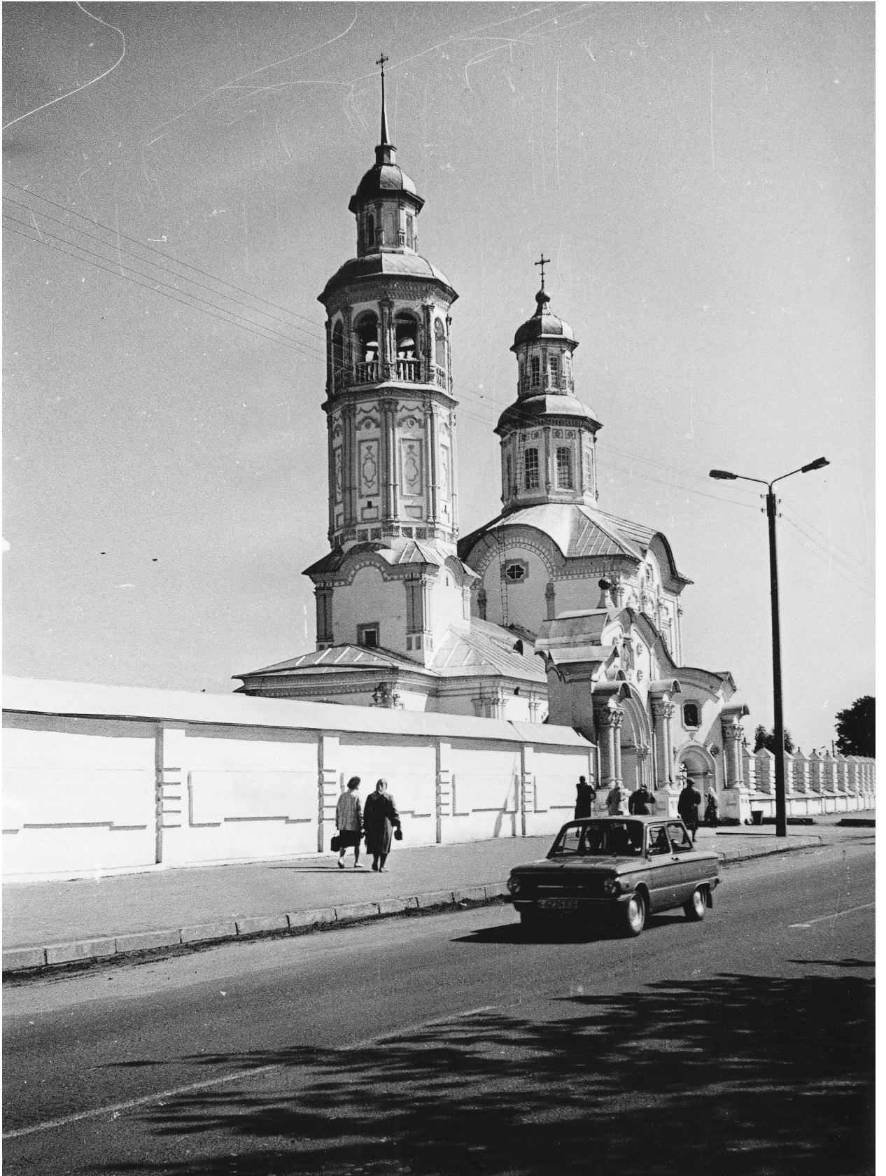
Фото 4. Троицкая церковь в селе Макарье после восстановления Июнь 1993 г.