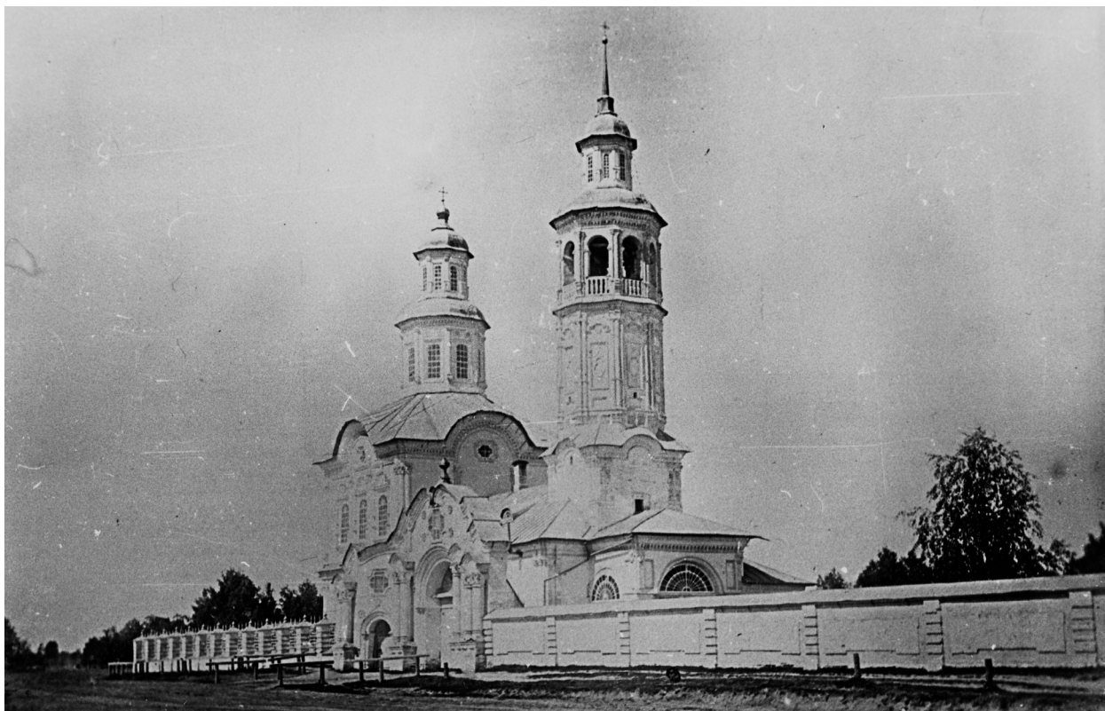
Фото 1. Троицкая церковь в селе Макарье. Начало XX века